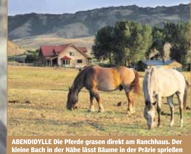
ABENDIDYLLE Die Pferde grasen direkt am Ranchhaus. Der kleine Bach in der Nähe lässt Bäume in der Prärie sprießen

Täglich 5 Stunden im Sattel – und nachts heulen die Kojoten